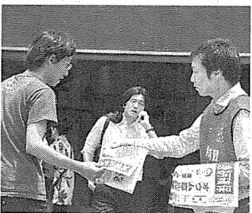
高橋容疑者身柄確保を伝える号外が配られた。港区新橋2丁目

オウム真理教元信徒の高橋克也容疑者(54)が逮捕された15日、新橋駅や立川駅周辺など都内外9カ所