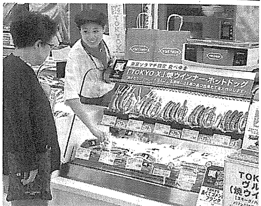
ソーセージやハンバーグなど「TOKYO X」の加工品が並ぶ専門店