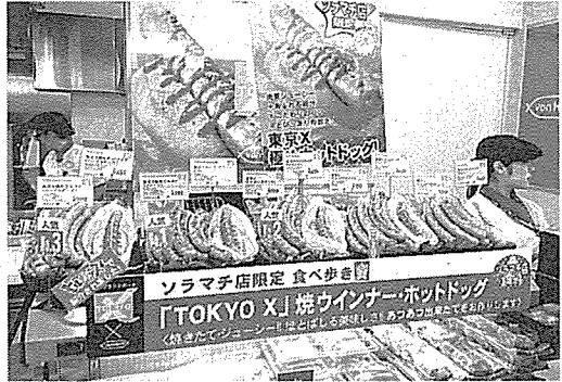
「東京ソラマチ」の店ではウインナーな どにして販売している(東京都墨田区)

った家畜の食肉の脂肪は溶 ける温度が低く、食べた時 比べて高価だが、農家から の脂肪の食感が良くなると 豚の出荷価格は変えない